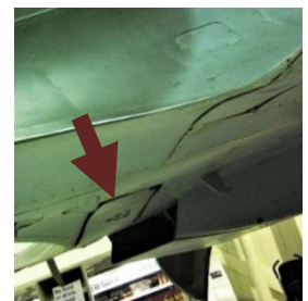
〔スピットファイアの主翼付根下面↑〕